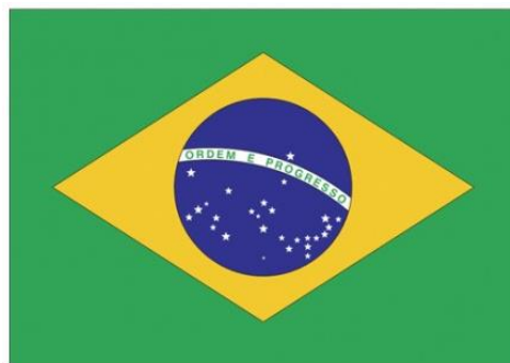
Bandeira da República dos Estados Unidos do Brasil estabelecido pelo decreto Nº 4 do governo provisório em 19 de novembro de 1889

representaria o progresso . Por isso da nova bandeira do Brasil, a derradeira bandeira do Brasil, ter as palavras Ordem e Progresso escritas, já que idealizada pelos figurões do positivismo brasileiro Raimundo Teixeira Mendes e Miguel Lemos 14 que repetidamente atribuíram a Benjamin Constant, outro figurão do positivismo (mas este teve apenas a função de interceder pela bandeira de Teixeira Mendes ante os altos escalões da República), remontando a força da doutrina positivista entre os líderes da Primeira República.